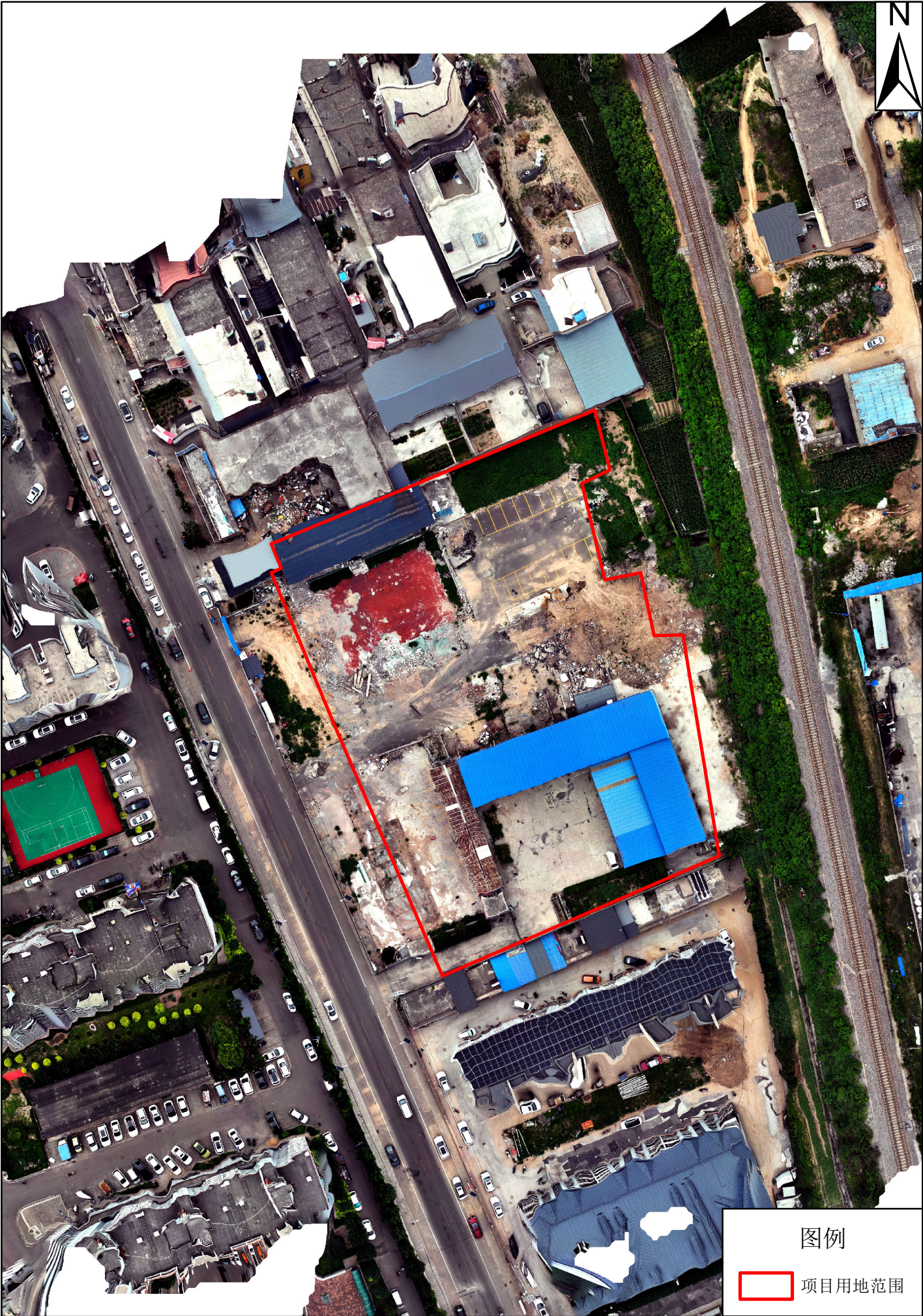
中阳县2025年第四批次建设用地项目影像图