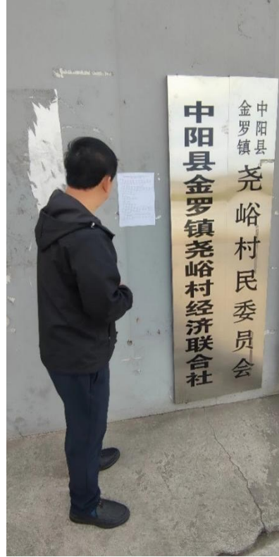
图 1.4-3 张贴公示照片

3) 登报公示。中阳县产城融合发展服务中心分别于 2023 年 10 月 19 日和 2023 年 10 月 24 日在《山西科技报》上进行了规划环境影响评价的登报公示。公示如下图所示。